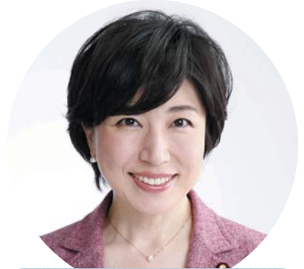
木村やよい 衆議院議員

最後になりましたが、京都三区（京都市伏見区、長岡京市、向日市、大山崎町）にご家族・親類・ご友人等がいらっしゃいましたら、ぜひご紹介をお願いいたします。