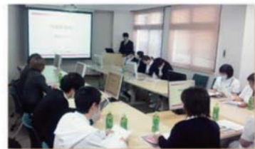
睡眠セミナーの様子