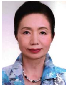
(公社)千葉県看護協会 会長