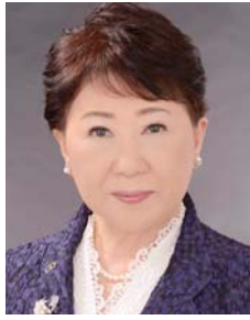
日本看護連盟 会長