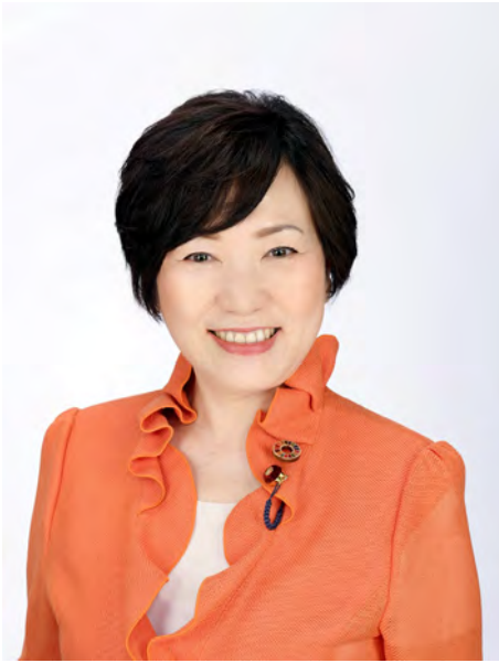
あべ 俊子 衆議院議員