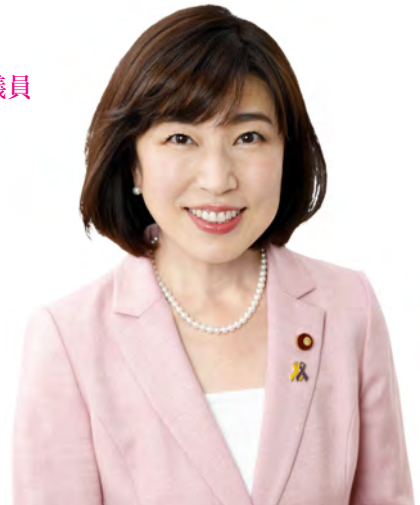
木村 やよい 総務大臣政務官 衆議院議員

コロナ禍で大変な思いをして頑張っておられる全ての看護職の仲間たちに、心からのエールと新年のご挨拶を申し上げます。