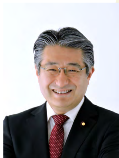
石田 まさひろ 参議院議員

看護師の国会議員として私も、皆様が笑顔で「今日もいい看護ができた」と言っていただけよう必死で働きます。