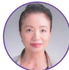
(公社)千葉県看護協会 会長

最後になりますが、これからも残暑が続きます。どうぞお身体をご自愛ください。皆様には今まで同様、看護協会へのご支援も重ねてお願い申し上げます。