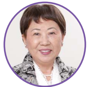
日本看護連盟 会長