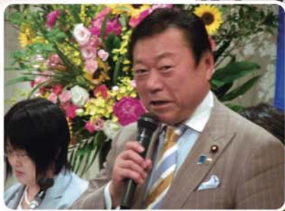
▲国会中にもかかわらず駆けつけてくださった桜田義孝衆議院議員