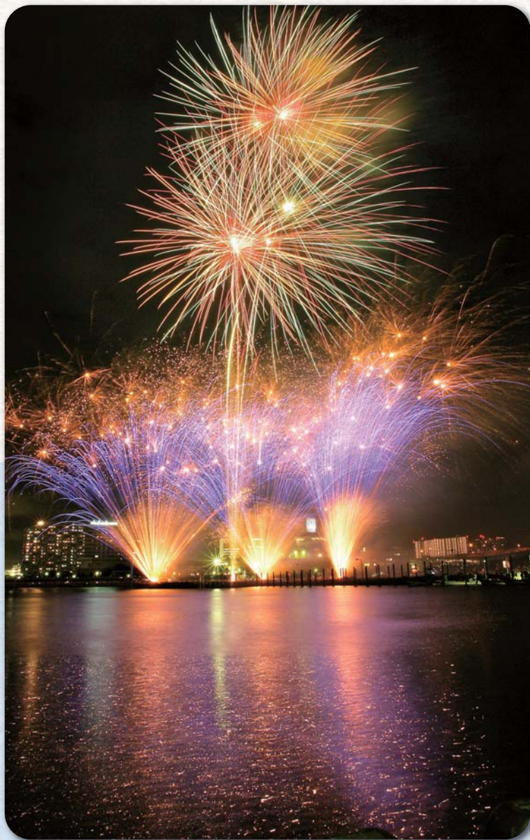
船橋親水公園花火