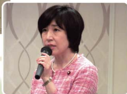
▲「特別講演」を行う木村やよい衆議院議員

総会は、報告事項・審議事項と全て承認され無事終了した。その後、昨年12月の衆議院選挙でみごと初当選された「木村やよい議員」による「特別講演」が開催された。