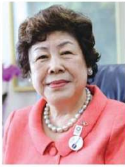
日本看護連盟 会長