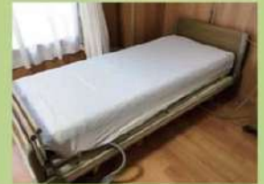
エアーマット使用例