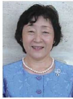
公益社団法人 千葉県看護協会 会長

令和の時代、連盟活動は、「立」から「律」への意識変革です。「立」とは経済的・技能的自立で、「律」とは自分なりの価値基準や信条、理念をもち自ら判断・行動することです。「自律した看護職」として、明るく・楽しく・元気に、進めて参りましょう。