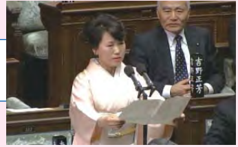
第186回通常国会 開会日

衆議院の議院運営委員会の一員として「議長〜!」と議長に発言を求め、会議の進行を促す役を担っています。