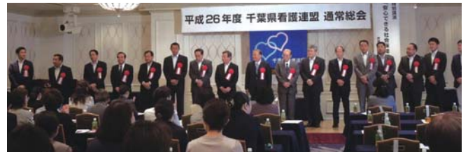
総会に御出席いただきました看護連の先生方