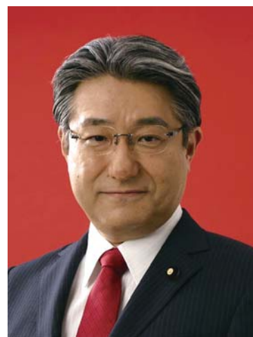
石田 まさひろ 参議院議員