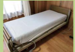
エアーマット使用例