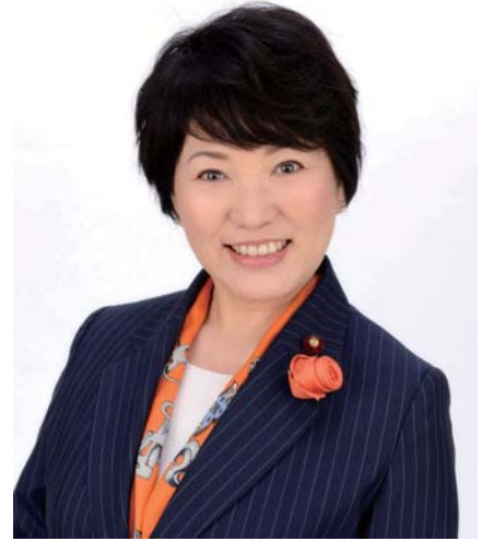
あべ 俊子 衆議院議員

本格的な超高齢社会が到来し、これまで以上に看護職の皆様のお力が必要です。皆様がやりがいをもって看護に当たることができるよう、引き続き現場の声にしっかりと耳を傾け、全力で取り組んでまいります。今後とも皆様からのご支援を賜りますよう心よりお願い申し上げます。