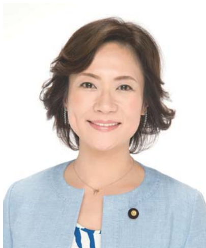
たかがい 恵美子 参議院文教科学委員長 参議院議員

千葉県看護連盟の皆さまにはおかれましては、お健やかに過ごしのことと拝察いたします。酷暑の中、相次ぐ豪雨災害に心を痛めております。微力ですが、一刻も早い改良復旧をめざし、現場第一主義で対応を続けて参ります。幅広い年代の方が各地で看護の灯を必要としています。厳しい毎日ですが、互いに気持ちを強く持って、健やかに励んで参りましょう。